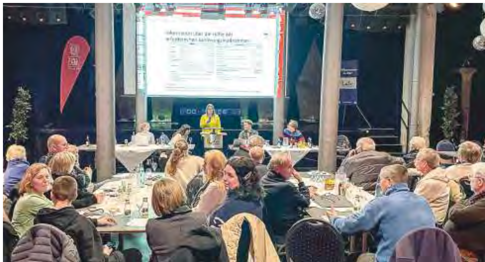
Foto von der außerordentlichen Mitgliederversammlung.